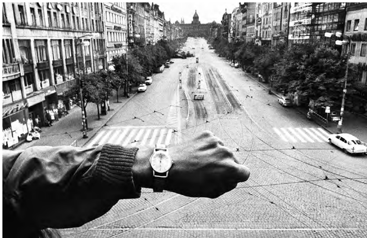
Joseph Koudelka, Invasión de Praga , 1968

Consideremos una casa, por ejemplo, no es más que una colección de átomos y moléculas