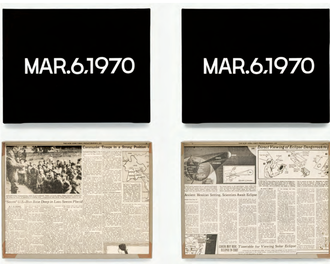
On Kawara, 6 de marzo 1970

Cambiarle el signo algebraico al tiempo (sustituir t por -t ) no sólo engendra absurdos dignos del País de las Maravillas en las películas. En la novela La flecha del tiempo del escritor británico Martin Amis el tiempo fluye hacia atrás. El narrador cuenta que, en los campos de concentración, los nazis metían cenizas en los hornos y sacaban cuerpos muertos que resucitaban cuando los metían en la cámara de gas, tras lo cual los ponían en li-